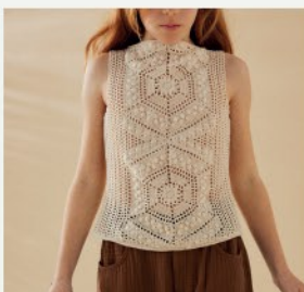
6. Le débardeur Tenessy PHIL PERLE 5 - P.12 CROCHET