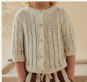
7a. Le gilet Tatiana PHIL RUSTIQUE - P.13 TRICOT