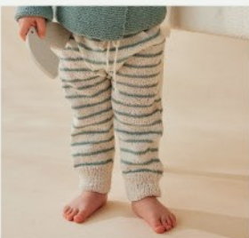
2a. Le legging Tessa PHIL ORIGIN - P.7 TRICOT