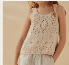
10a. Le top Teodora PHIL RUSTIQUE - P.16 TRICOT