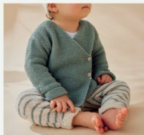
1a. La brassière Tess PHIL ORIGIN - P.6 TRICOT

Niveau Facile : Explications adaptées au niveau débutant.