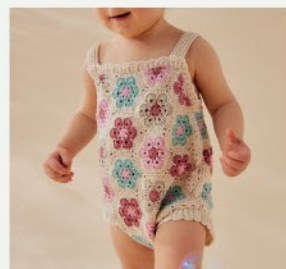
4. La barboteuse Thya PHIL PERLE 5 - P.9 CROCHET