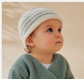
3a. Le bonnet Théa PHIL ORIGIN - P.7 TRICOT