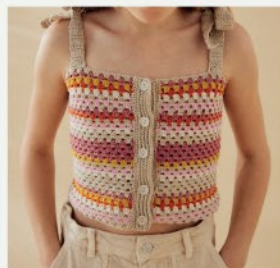
12. Le top Tracy PHIL PERLE 5 - P.20 CROCHET