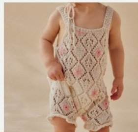
9. La combi Tahis PHIL ORIGIN, PHIL COTON MIMI - P.14 TRICOT