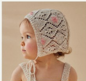
8. Le beghin Tahis PHIL ORIGIN, PHIL COTON MIMI - P.14 TRICOT