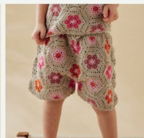
16. Le short Teha PHIL PERLE 5 - P.22 CROCHET