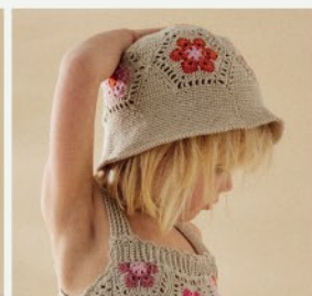
17. Le bob Telma PHIL PERLE 5 - P.23 CROCHET

POUR CONNAÎTRE VOTRE NIVEAU, REPORTEZ-VOUS À NOTRE GRILLE EN FIN DE CATALOGUE.