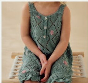
5a. La combi Tanya PHIL ORIGIN, PHIL COTON MIMI - P.10 TRICOT