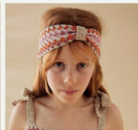
13. Le head band Tory PHIL PERLE 5 - P.20 CROCHET