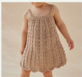
11a. La robe Tamara PHIL RUSTIQUE - P.18 TRICOT