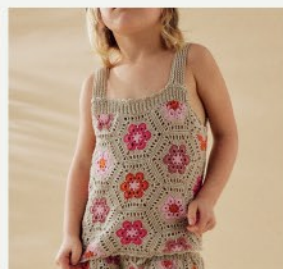
15. Le débardeur Tina PHIL PERLE 5 - P.22 CROCHET