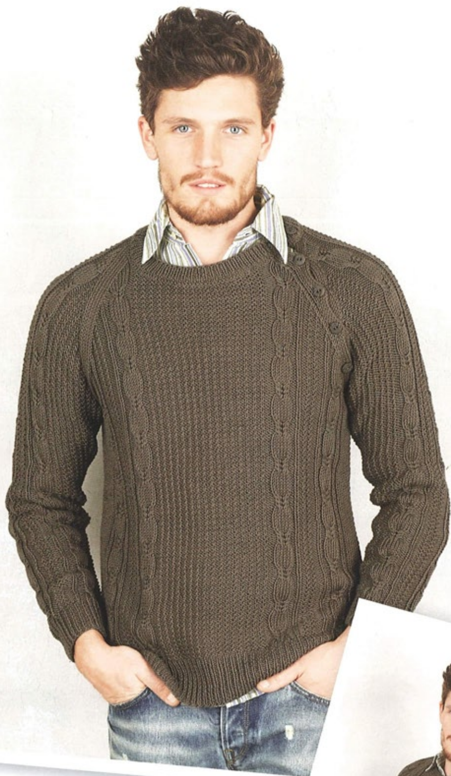
26 / LE PULL HOMME A TORSADES des torsades et une maille reliefée centrale pour un pull homme au raglan fermé par 6 boutons , tricoté en PHIL ETIK