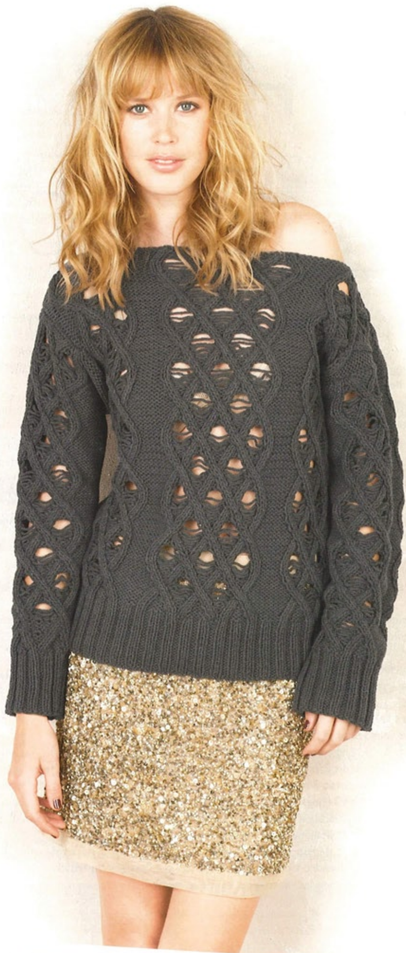
31/ LE PULL IRLANDAIS un motif croisillons et des jours échelle pour ce pull tube irlandais, tricoté en AVISO