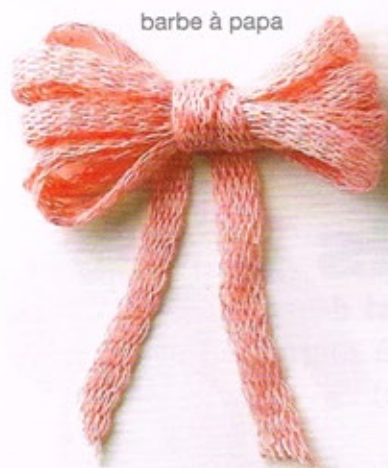
barbe à papa