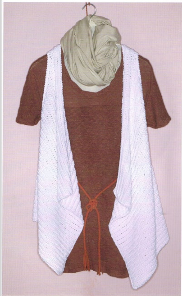
Gilet JUDSON sans manches blanc