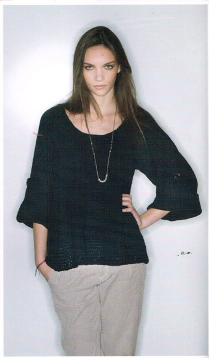
Tunique CAROL noir