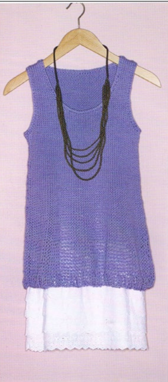
Débardeur SUGAR glycine