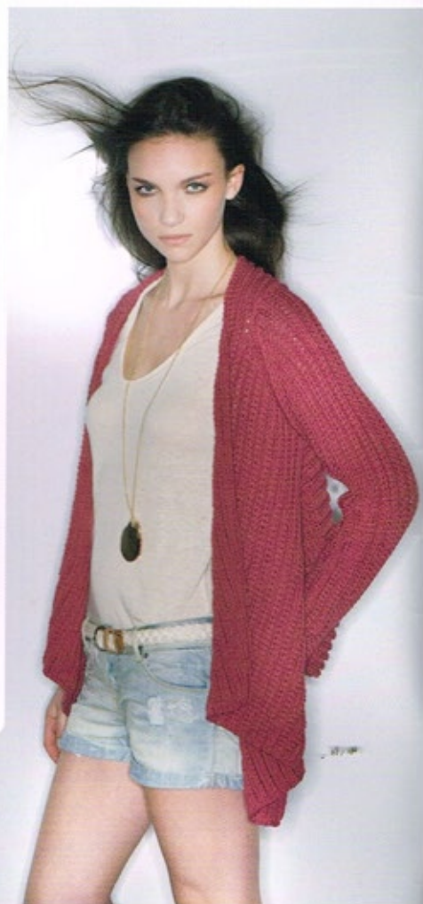
Gilet JUDSON manches longues cranberry