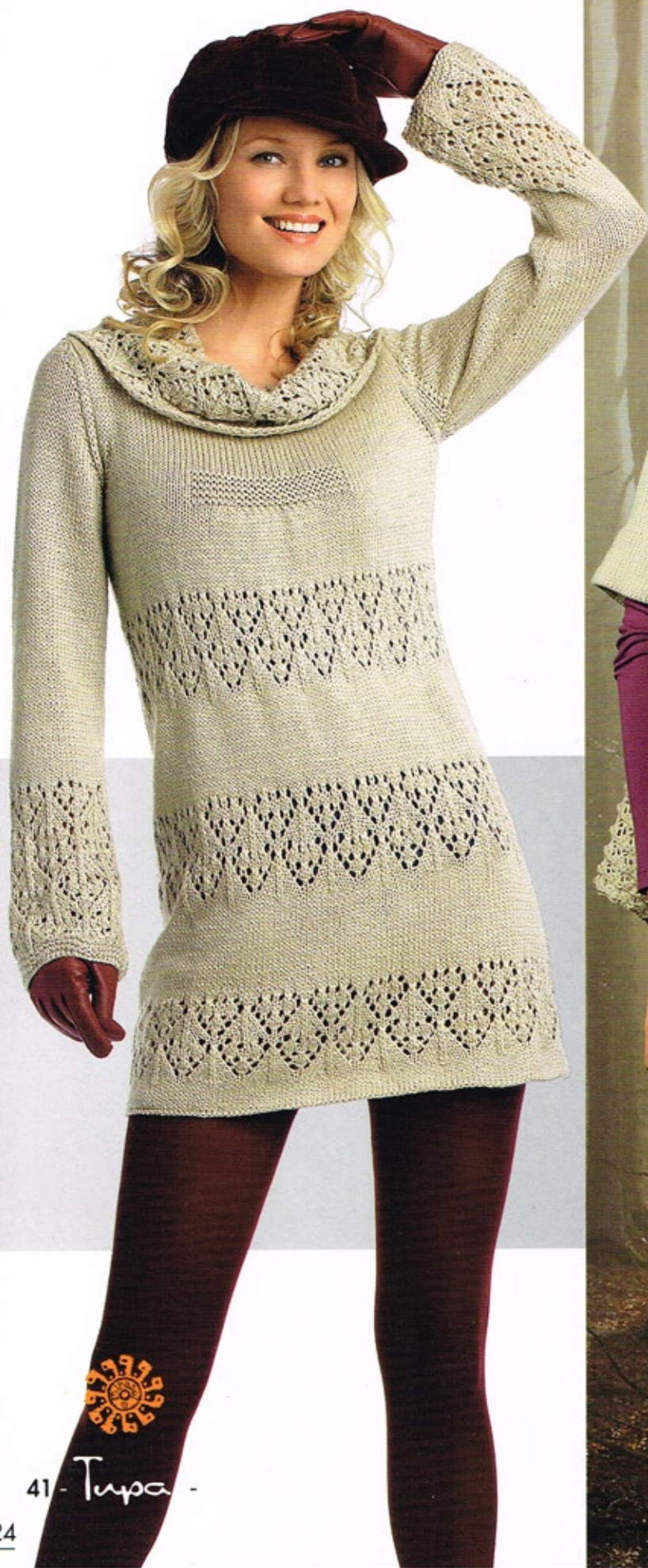
41 - Tupa -