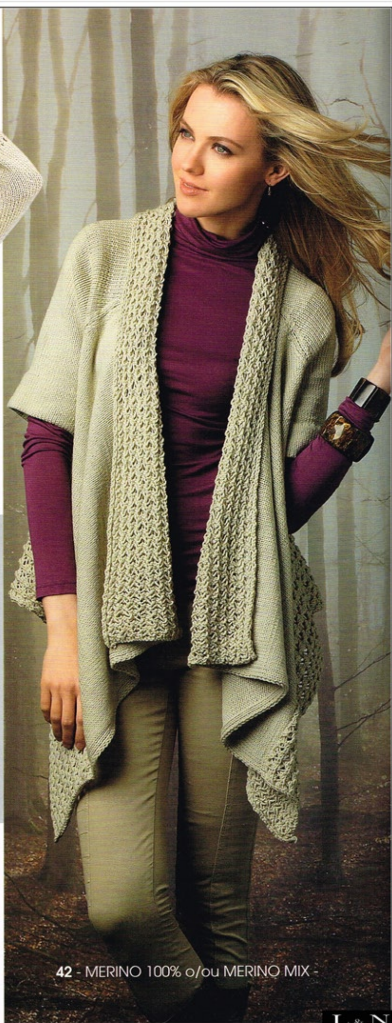
42 - MERINO 100% o/ou MERINO MIX -