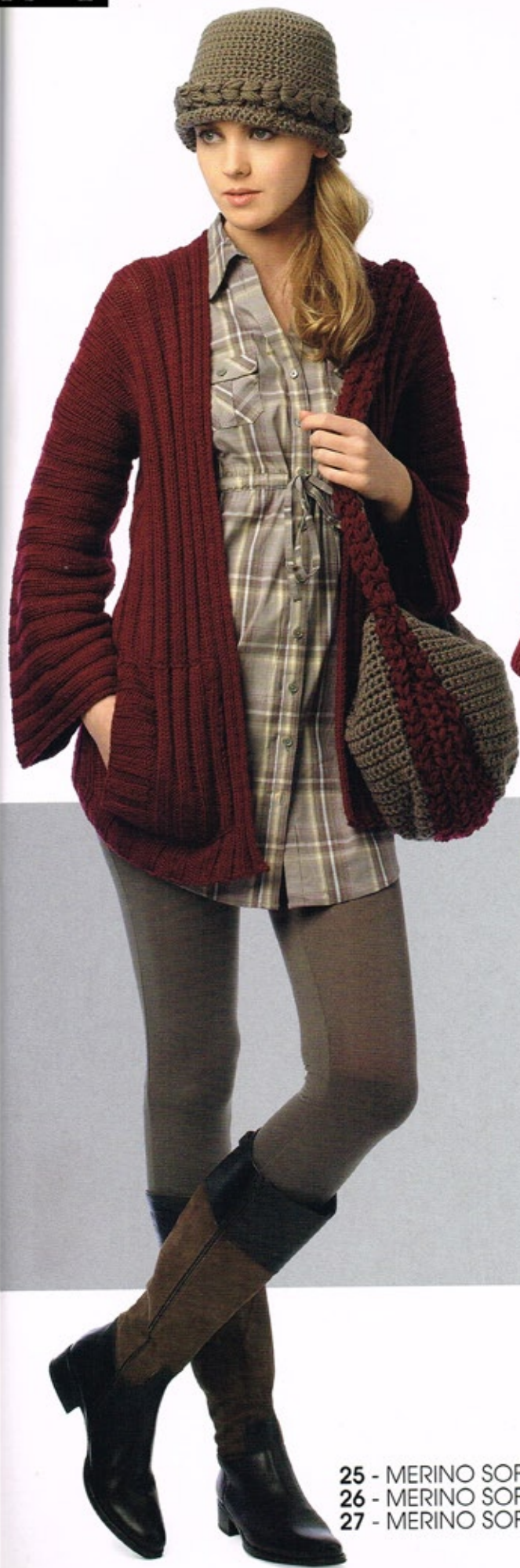
25 - MERINO SOFT - 26 - MERINO SOFT - 27 - MERINO SOFT -