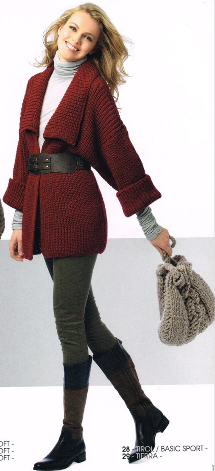
28 - TIROL / BASIC SPORT - 29 - TIERRA -