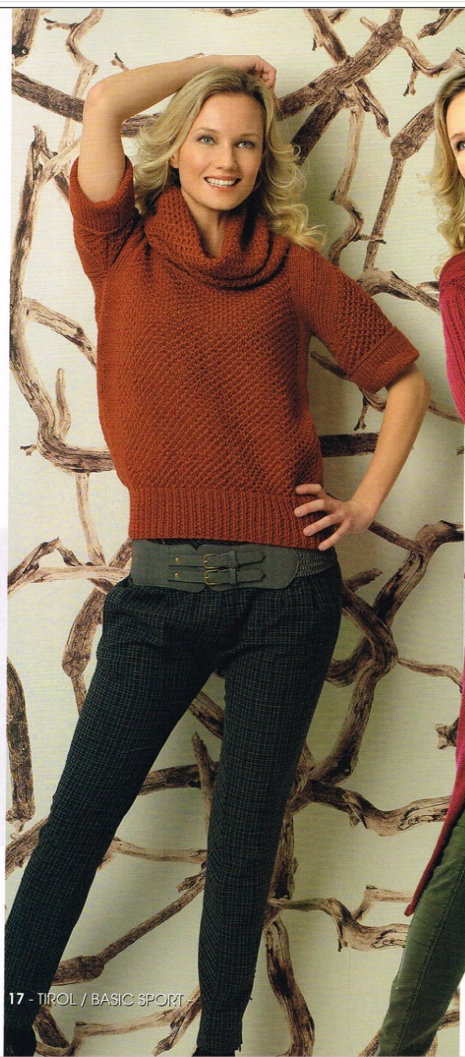
17 - TIROL / BASIC SPORT