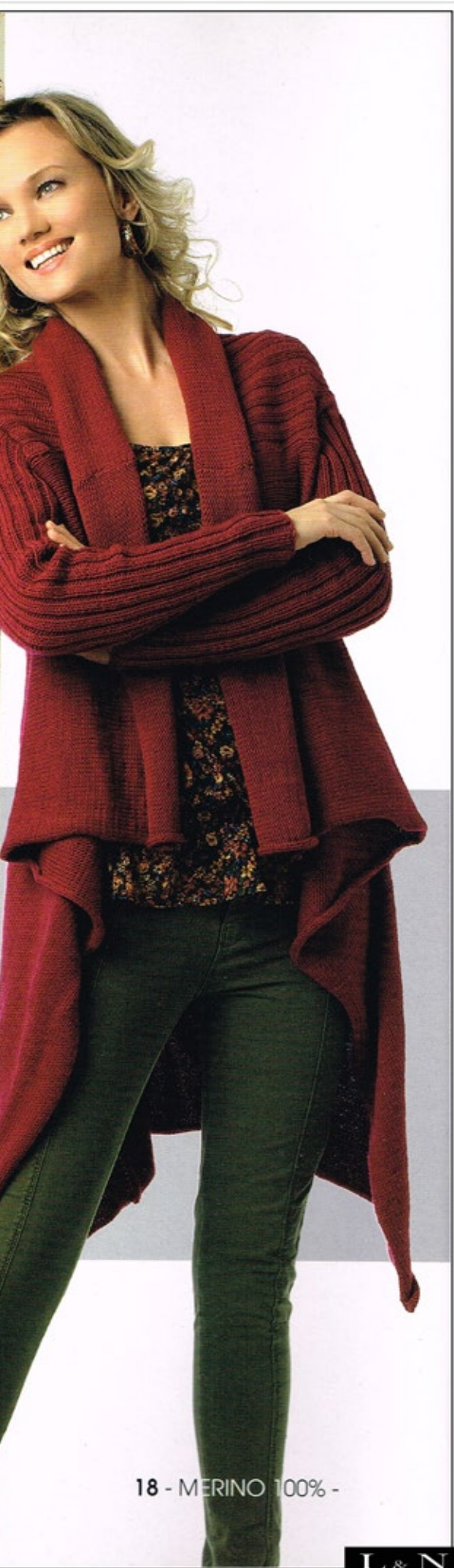
18 - MERINO 100% -