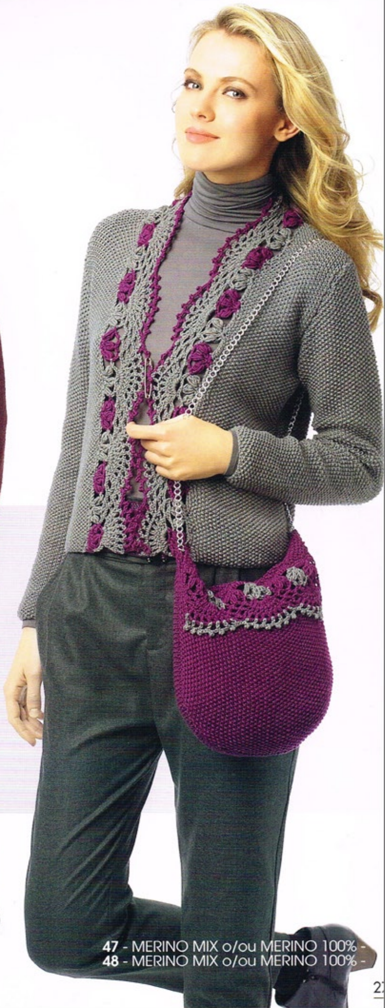
47 - MERINO MIX o/ou MERINO 100% - 48 - MERINO MIX o/ou MERINO 100% -