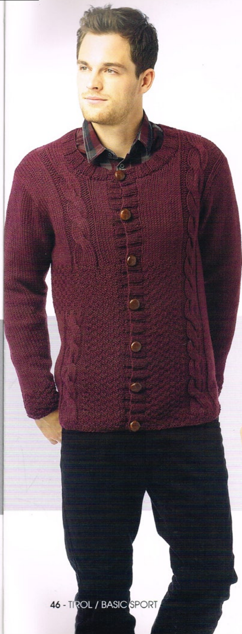
46 - TIROL / BASIC SPORT