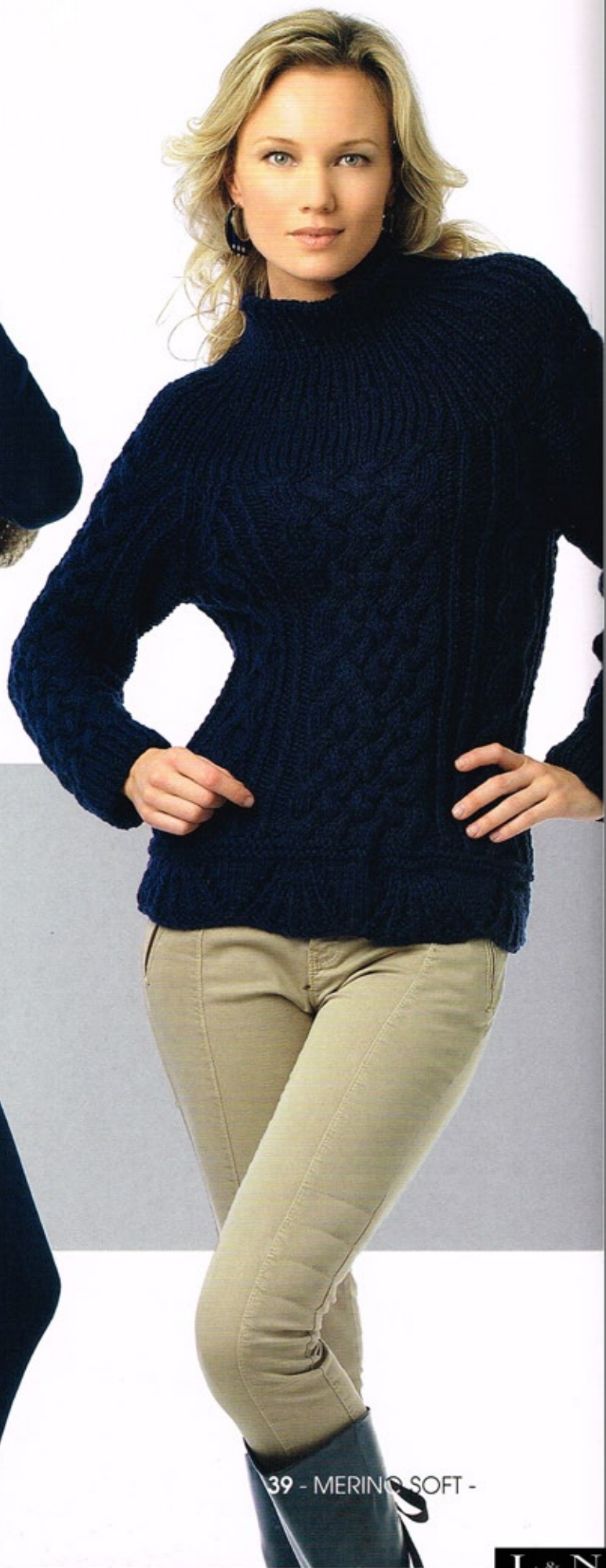
39 - MERINO SOFT -