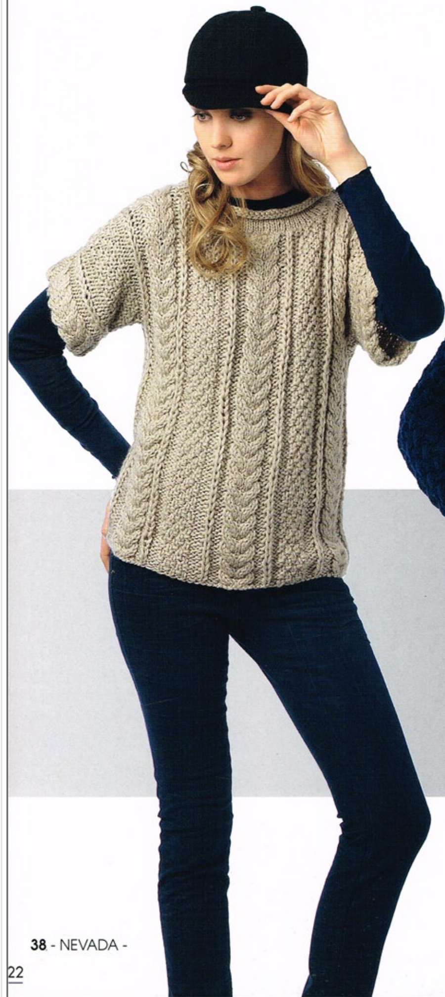
38 - NEVADA -