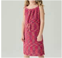
La Robe Gaelle