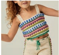
Le Débardeur Gwendoline