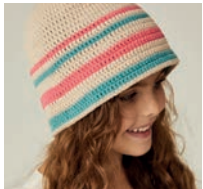
Le Chapeau Grazia