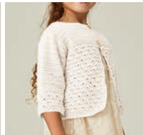
Le Gilet Heidi