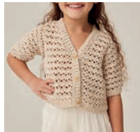
Le Gilet Géraldine