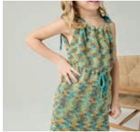
La Robe Gaelle