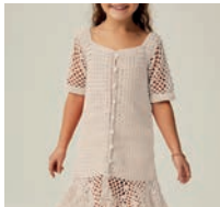
La Robe Genna