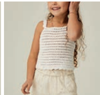
Le Débardeur Gladys